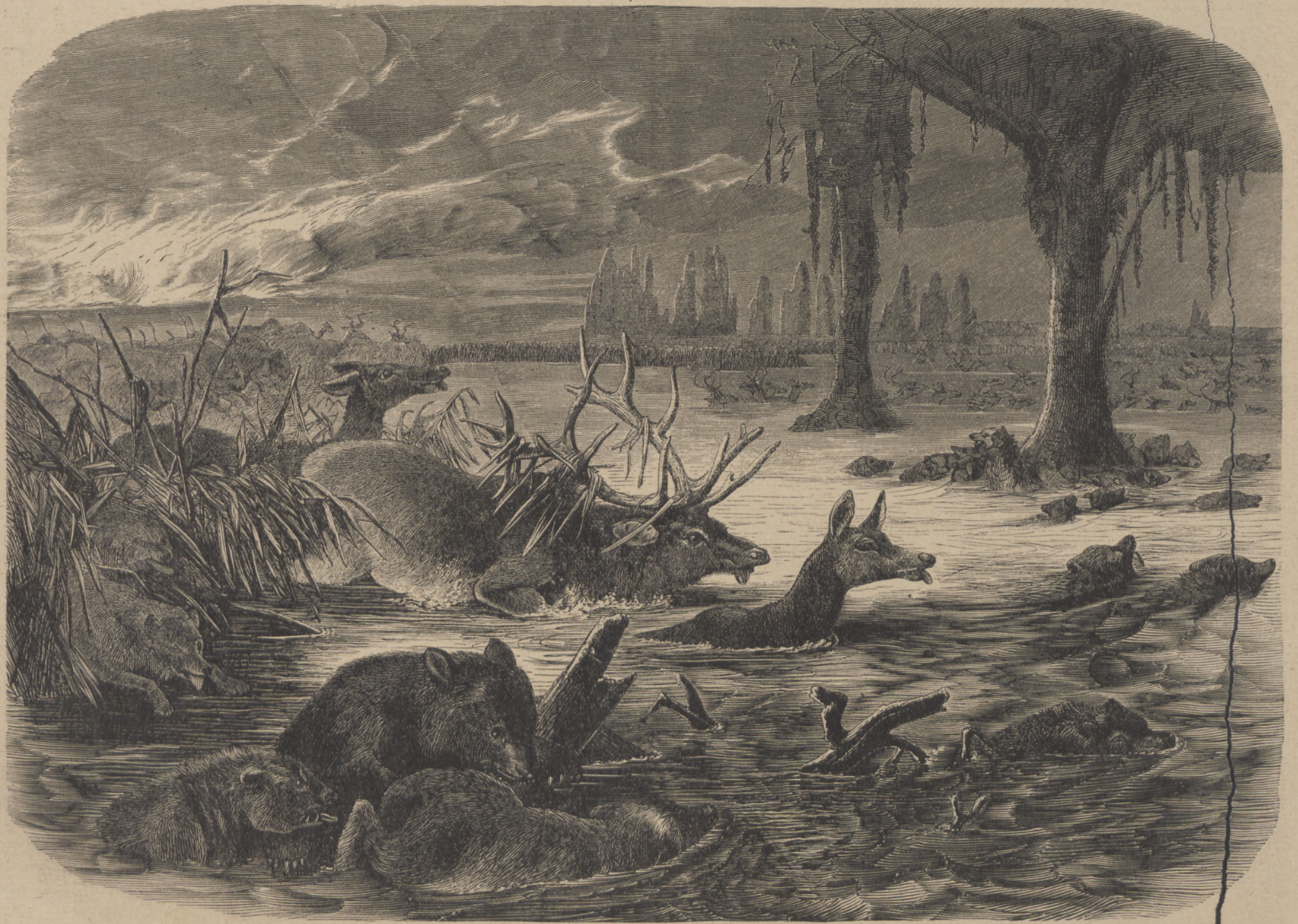
Ein Prairiebrand. (Mit Text auf Seite 40.)