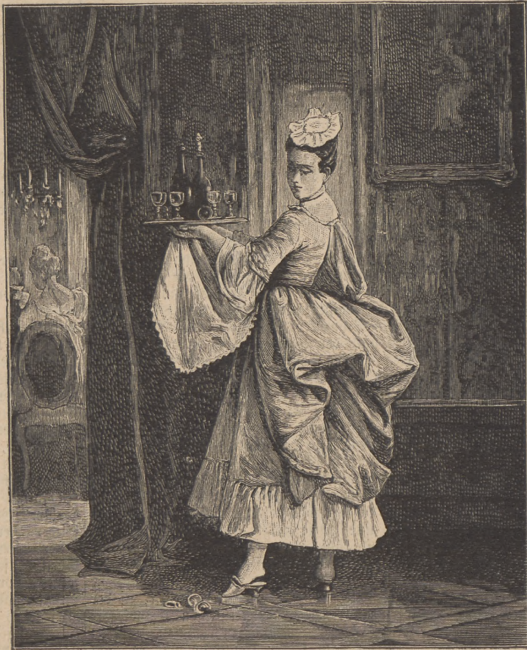
Die Aufwärterin. (Mit Text auf Seite 40.)

O, wenn er in diesem Augenblick in die Augen des Mädchens gesehen, daß er zu sich erheben wollte! Wie würde ihn dieser Ausdruck des Triumphes erschreckt haben, der allein jetzt Hilda's Blick belebte. Aber die