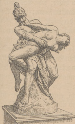
Der Raub der Sabinerin (Statue von N. Vegas).

Für unsre Zeit der großen Umwälzungen und weittragenden Entdeckungen auf allen Gebieten der materiellen und geistigen Kulturentwicklung bewahrheitet sich mehr denn je zuvor das Wort: „Stillstand ist Rückschritt“. Kein Zweig der Wissenschaft, der Technik und Kunst, kein Feld der Politik und des Handels, wo nicht in einem Jahrzehnt gänzlich veränderte Anschauungen gewonnen und völlig neue Bedingungen für die Fortentwicklung geschaffen würden. Wenn es schon für den mitten in diesem titanenhaften Vorwärtsdrängen stehenden Fachmann immer mühevoller wird, Schritt zu halten und den Überblick über sein Gebiet nicht zu verlieren; wenn schon der Gelehrte, der Techniker, der Kaufmann immer mehr auf eine engere Begrenzung seines Arbeitsfeldes, auf ein „Spezialfach“ hingeführt wird, um so in immer tiefer gehender Arbeitsteilung dem großen Gesetz logischer Weltentwicklung am besten dienstbar zu werden, so ist es für den außerhalb dieser einzelnen Gebiete stehenden Beobachter doppelt schwierig, dem Gang des Ganzen zu folgen, soweit es nicht sein eignes Fach angeht.