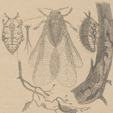
Mehltau (Phylloxera vastatrix).

Der Kartenapparat, dessen kleiner Maßstab in frühern Auflagen nicht allen Anforderungen zu entsprechen vermochte, bildet jetzt mit seinen 40 Neustichen einen prächtigen Atlas der Geographie und Geschichte. Den Karten der europäischen Staaten wurden als zeitgemäße Bereicherung ausführliche Texte über die staatliche Organisation, über Heerwesen, Marine u. a. m. beige druckt. Ebenso erfuhren die Illustrationsbeilagen eine wertvolle Vermehrung an zahlreichen einzelnen Figuren wie an 18 neuen Tafeln, von denen 6 farbenprächtige Aquavell drucke dem Buch zur besondern Zierde gereichen.