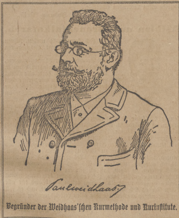
Begründer der Weidhaas'schen Kurmethode und Kurinstitute.

Ärztliche Anerkennungen über die „Weidhaas'sche Kur“: