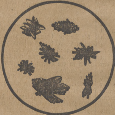
Sediment eines hart sauren Hornes.