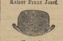
Kaiser Franz Josef