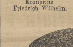
Kronprinz Friedrich Wilhelm.