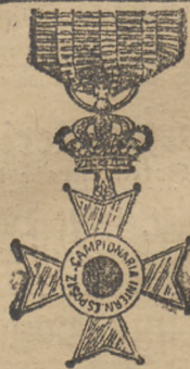
Ehrenkreuz Rom 1902.