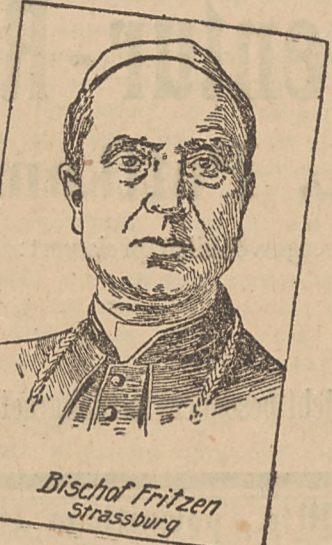
Bischof Fritzen Strassburg