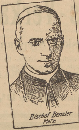
Bischof Benzler Metz