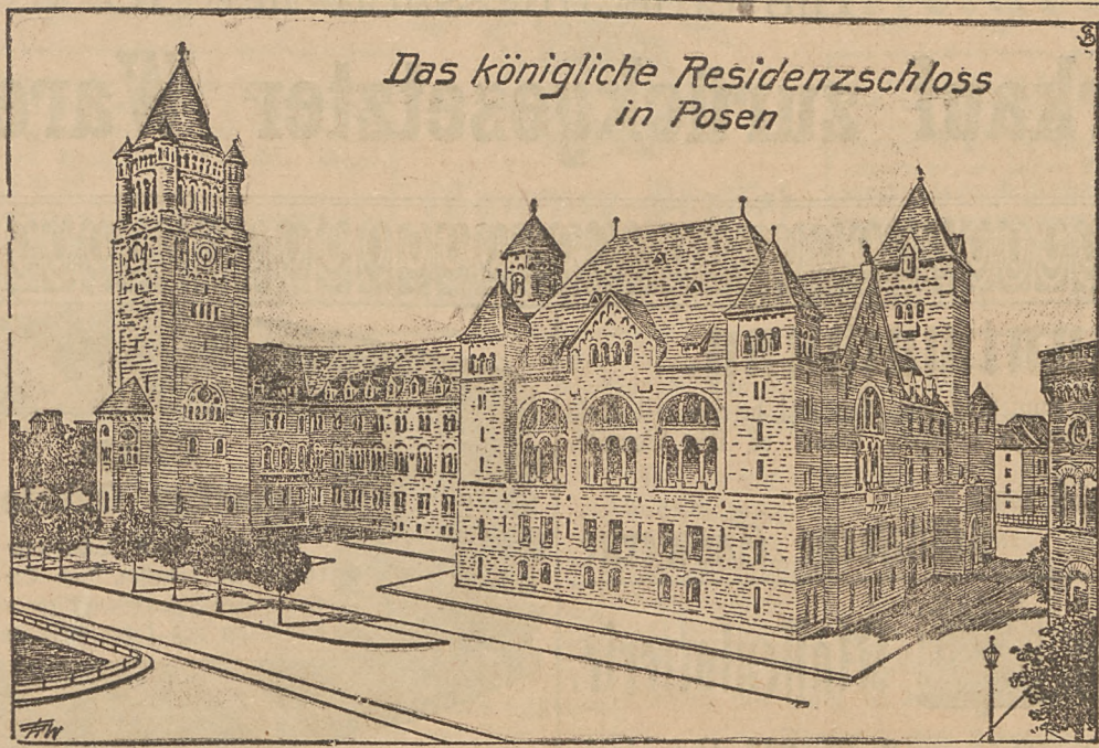
Das königliche Residenzschloss in Posen

Die Erhebung zeigt, dass der Alkoholverbrauch der Arbeiterfamilien nicht nur der bei der vorerwähnten Sonderuntersuchung betrachteten unter 2000 Mark Jahresausgabe war, sondern unter 2000 Mark Jahresausgabe wurden für alkoholische Getränke im Hause oder im Wirtschaftshause jährlich 62,46 Mark ausgegeben.