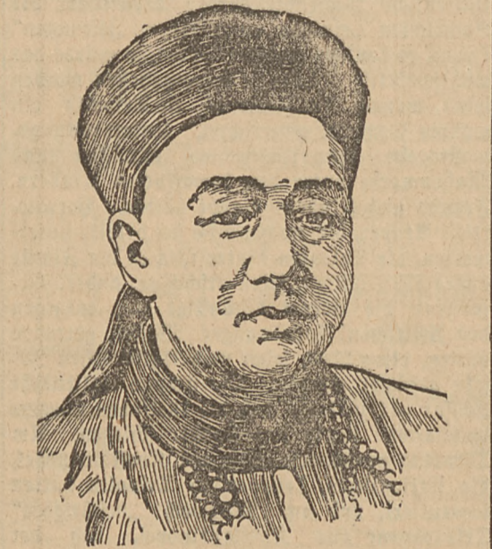
Der „Präsident der chinesischen Republik“.

Der triumphierende Juanschikai. Nach dem „Bureau Reuter“ hat Juanschikai an die Regierung telegraphisch das Ersuchen gerichtet, einen interimistischen Premierminister zu ernennen, während er alle Angriffe der Kaiserlichen einstellen lassen und unzerzückt mit Liuanheng wegen eines endgiltigen Friedensschlusses in Unterhandlungen treten werde. Juanschikai will sich, falls er nicht auf andere Weise Unterhandlungen herbeiführen könne, in das Lager der Aufständischen nach Wutshang begeben. — Amtlich wird bereits bekanntgegeben, Juanschikai ist zum Premierminister ernannt worden, der frühere Generalgouverneur von Kanton Weiuangtao zum Generalgouverneur von Suifuang, General Jintshang zum Chef des Generalstabes, Prinz Tsching zum Vizepräsidenten des Geheimen Rats. Das Kabinett soll gebildet werden, wenn Juanschikai das Amt des Premierministers übernimmt. In der Zwischenzeit sollen Prinz Tsching als Premierminister, Natung und Hüjtschchang als seine Beigeordneten fungieren. — Ein kaiserliches Edikt genehmigte den Rücktritt aller Minister.