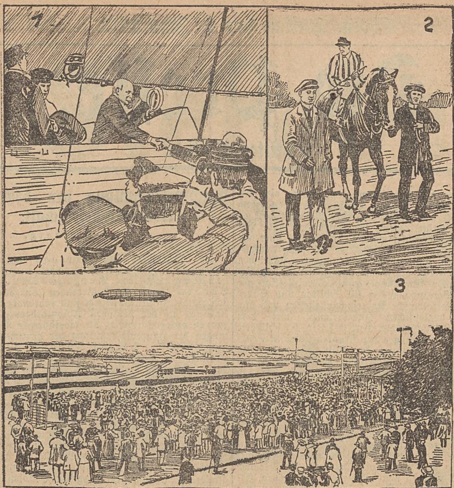
Empfang des Grafen Zeppelin in Hamburg. 2) Der Gradiger Gulliver II, jetzt im 100,000-Mark-Preis. 3) Das Luftschiff „Z 3“ über dem Hamburger Rennplatz bei Hamburg.

(Schwere Bluttat.) Entsetzlich zu-gerichtet wurde Mittwoch in früher Morgen-stunde in Berlin ein patrouillierender Polizei-beamter auf dem Gesundbrunnen. Der Schutzmann Haack hatte nach 2 Uhr gemein-sam mit dem Schutzmann Kittelmann einen Patrouillengang durch die Straßen des Ge-sundbrunnens angetreten. Als die beiden Beamten die Bellermannstraße entlang gingen, beobachteten sie in einem Hauseingang einen älteren Mann, der dort fest schlief. H. ging an den Schläfer heran und wollte ihn hoch-richten. Der Fremde glaubte, er solle zur Polizei-wache sifflert werden, zog plötzlich ein langes Messer aus der Tasche und stach mit solcher Wucht auf den Polizeibeamten ein, daß diesem der Unterleib total aufgeschlitzt wurde. H. brach blutüberströmt zusammen. Jetzt sprang Kittelmann hinzu, zog blank und verletzte dem Angreifer einen wuchtigen Säbelhieb über den Kopf. Der Betroffene erhielt eine stark blutende klaffende Schädel-wunde und brach gleichfalls zusammen. Haack mußte schleunigst nach der Unfall-station gebracht werden, wo die Ärzte lange Zeit zu tun hatten, ehe der Schwerverletzte transportfähig fürs Krankenhaus war. Die Eingeweide sind dem Unglücklichen zumteil zerschneitten worden. Der Urheber des gräß-lichen Überfalles wurde als der 60 Jahre alte Kranzbinde Friedrich Voigt aus der Grün-thalerstraße ermittelt. W. mußte gleichfalls zur Unfallstation gebracht werden. Als Haack vom Tatort nach der Unfallstation in einem