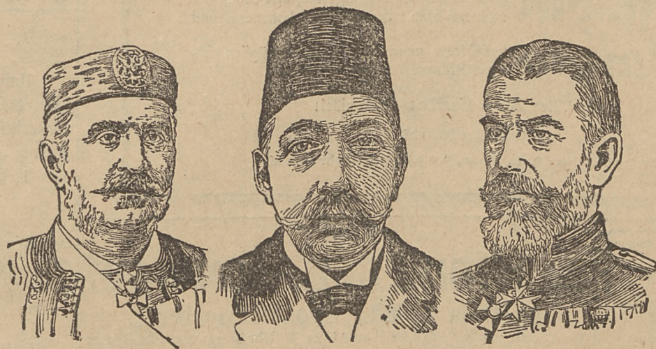
König Nikola von Montenegro. Sultan Mohammed V. Carol I. von Rumänien.