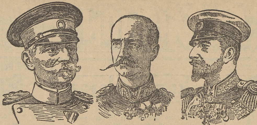
König Peter von Serbien. König Georg von Griechenland. König Ferdinand von Bulgarien.