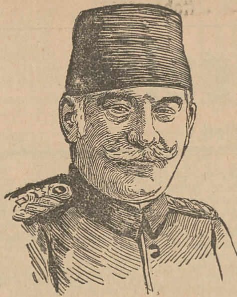
Nasim Pascha türkischer Kriegsminister

Zunächst besaß ihn nun Ahmed-Schah, der Gründer der Abdali-Dynastie von Kabul, der ihn von Schah Nooh, dem jungen Sohn Nadirs, hatte. Dann wurde der Diamant am Arme des Schah Schudschah, Nadirs Nachfolger, gesehen. Schudschah wurde aus Kabul vertrieben und befand sich unter dem Namen eines Gastes in der Gefangenschaft von Randschit Singh, der nicht ruhte, bis er den Stein für das Gegengeschenk einer Laß = 100 000 Rupien (etwa 200 000 Mark) an sich gebracht hatte. Er trug ihn dann als Armband (also wie es scheint, mit anderen Juwelen zu einem Schmud vereinigt) bei öffentlichen Gelegenheiten. Als Randschit auf dem Sterbebette lag, versuchte man ihn zu bewegen, den Stein dem Gotte Dschagarnath (Juggernauth) zu verehren; da er aber nur durch Neigen des Kopfes zugestimmt hatte, weigerte sich der Schatzmeister, ihn ohne bestimmtere Erklärung zu verabschieden. So blieb er also den nachfolgenden Herrschern erhalten, von denen ihn zuletzt Schir Singh trug, nach dessen Ermordung er unter den Kostbarkeiten von Lahor blieb. Als das Pendschab unter Dschit Singh dem englischen Indien einverleibt wurde, nahm England alle Schätze Bokhorés in Besitz, die dann der ostindischen Kompanie für Kriegskosten und Schulden zugesprochen wurden; diese aber beschloß, den Kohinur der Königin von England zu Füßen zu legen. Er wurde im April