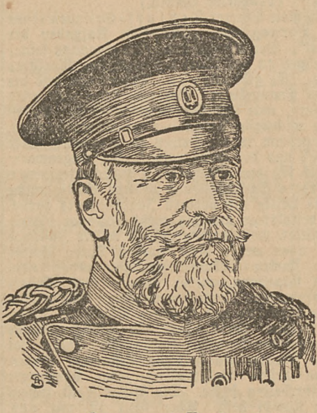
General Putnik serbischer Kriegsminister