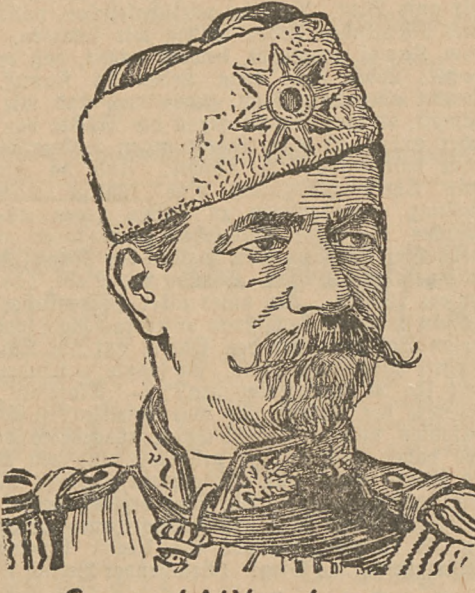
General Nikyphorow bulgarischer Kriegsminister