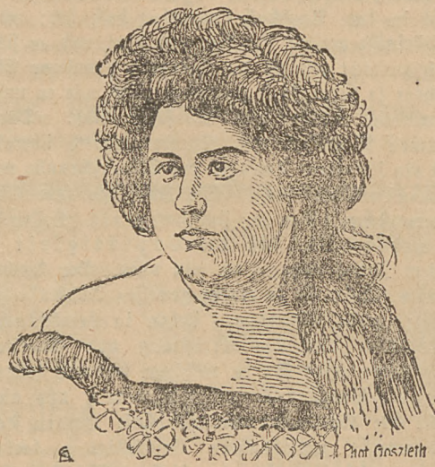
Die Flucht der Rhediven-Gattin.

Tödlicher Absturz des Fliegers Mercier. In Amberieu ist der Flieger Mercier Sonntag Nachmittag mit seinem Flugzeug abgestürzt und getötet worden.