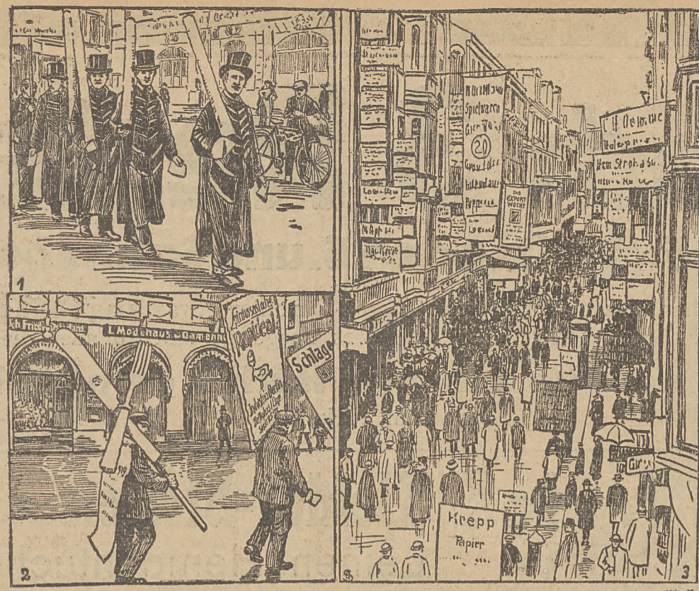
1. Neues in Gebrauchspapieren. 2. Modernes Vest. 3. Die Petersstraße im Zeichen der Messe.

Die Ordensschwindler in Paris. Anläßlich des jüngst aufgedeckten Ordensschwindels wurde in der Kan-