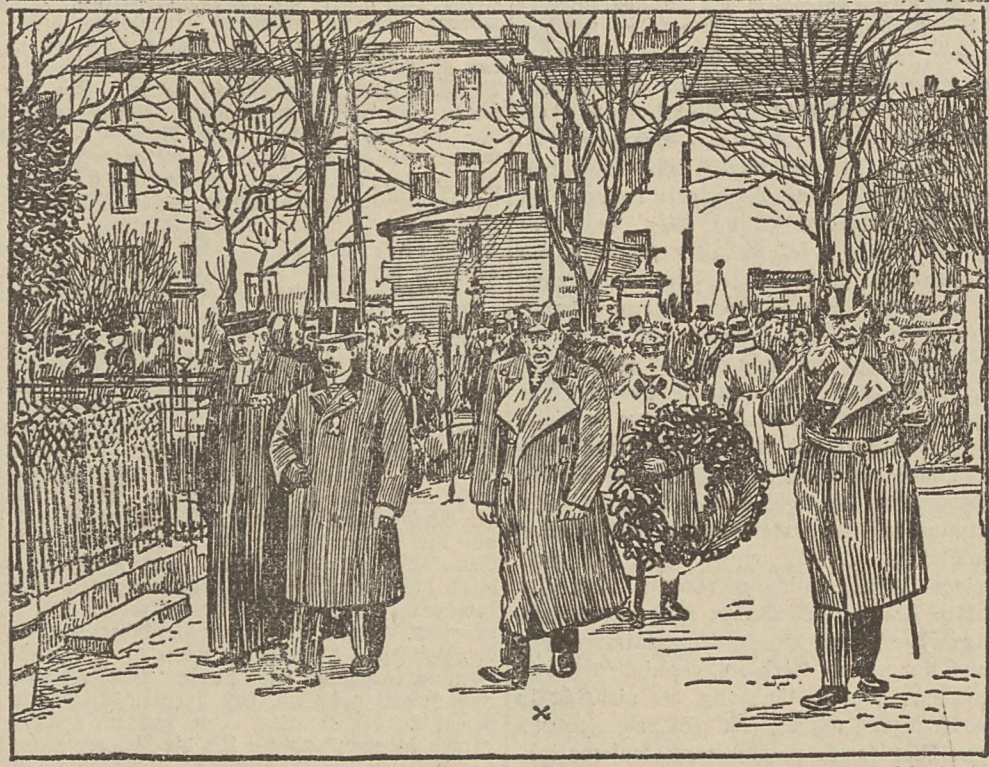
Oben: Matrosen S. M. S. „Pommern“ auf dem Wege zum Denkmal. Unten: Admiral von Libonius (X), der als erster Offizier der „Nympe“ am Gefecht teilnahm.