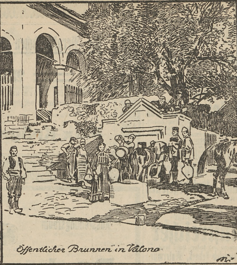
Öffentlicher Brunnen in Valona