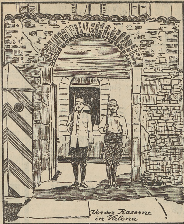
Vorder Kaserne in Valona

Jede Zeit, die ihr Sehnen zu solchem Ausdruck brachte, war künstlerisch groß, ohne alle Rücksicht auf technische Zerkleinerungen. In unserer Zeit aber ist diese Sehnsucht nicht mehr lebendig, nicht in den Alten. Die haben sich mit dem Leben abgefunden, wie es ist. Und sie gewahren garnicht, soweit sie Kunstpflege treiben, daß ihnen die Kunst von heute nichts bietet als ein wenig