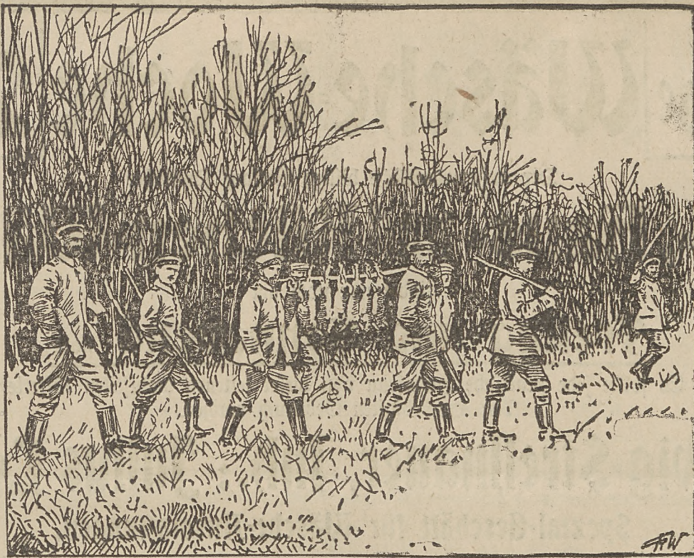
Soldaten kehren von der Hasenjagd zurück.

Bekanntlich besteht in Deutschland die Sitte, daß auf Befehl des Kaisers die Taufe eines Schiffes möglichst von einem direkten Nachkommen des Mannes, dessen Andenken durch den Schiffsnamen geehrt werden soll, vollzogen wird. Bei der Taufe des „Blücher“ war zu diesem Zwecke eine Nachkommnin unseres „Marshall Bornwärd“, die in England lebt, eingeladen worden. Dieser Zweig des fürstlichen Hauses war inzwischen in jeder Beziehung vollständig „verengländert“. Die Taufpatin konnte sich nicht entschließen, die Taufpatin konnte die deutschen Kriegsschiffe zu sprechenden Worte — etwa ein Dugend! — in deutscher Sprache zu reden. Sie sagte in Gegenwart des deutschen Kaisers ihr Sprößlein ganz ungeniert in englischer Sprache her und taufte, um der Rücksichtslosigkeit die Krone aufzusetzen, den Panzerkreuzer zum Entsetzen der Anwesenden auf den Namen „Bludscher“. Nur