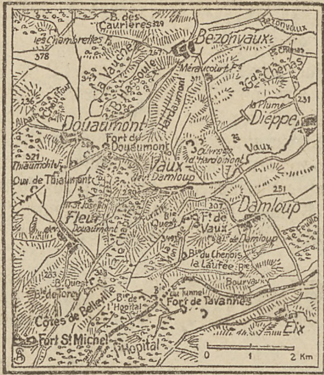
Karte zur Eroberung des Forts Thiaumont und des Dorfes Fleury.