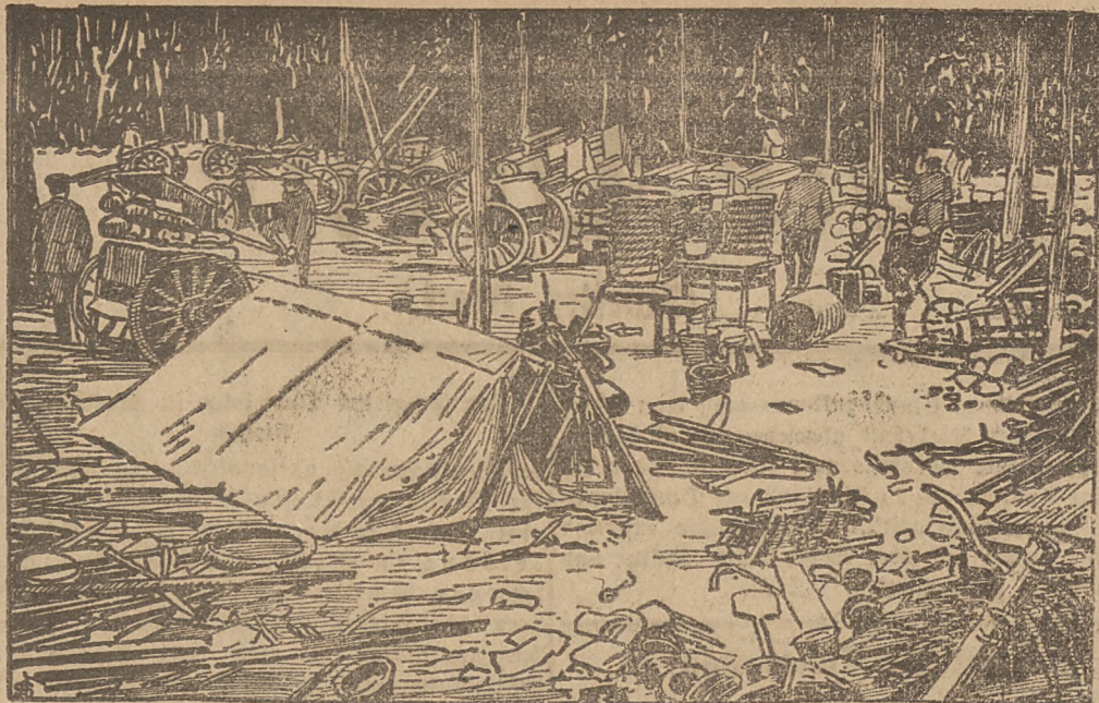
Russisches Kriegsgewehr, das auf dem Vormarsch der deutschen Truppen in den baltischen Provinzen erbeutet wurde.

(Folgschwere Gasexplosion.) Auf dem Stahlwerk Markt in Dörfel (Westfalen) hat sich eine Gasexplosion ereignet, wobei sieben Personen schwer verletzt wurden.