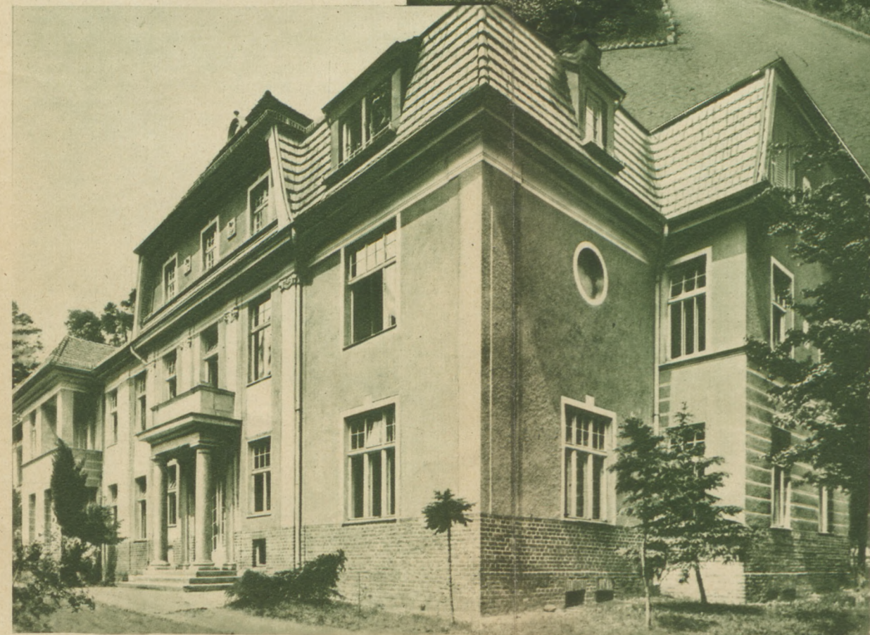
▼ Sanatorium dla uzdrowieńców