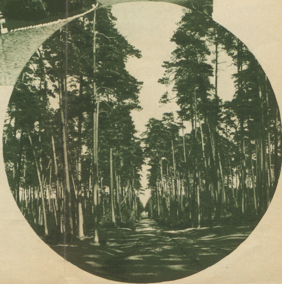
▼ Fragment parku

Jako pomocnicze środki lecznicze stosujemy w ściśle dobranych wypadkach przetwory złota, wlewania wapnia, tuberkuline, krzem i niejedne inne leki, co do których nauka sąd swój wydała. Sanatorium nie może być terenem dla eksperymentów na pacjencie. Obraz gruźlicy płuc pozornie tak jednolity, jest bardzo bogaty w odmiany. Niema dwóch chorych pod względem chorobowym sobie równych. To też na indywidualnem przystosowaniu odpowiedniego sposobu leczenia do każdorazowego obrazu klinicznego polegają sztuka i skuteczność leczenia. Leczenie gruźlicy płuc w okresach rozwoju powinno być tylko sanatoryjne. Pierwsze miejsce zajmuje kuracja klimatyczno-dietetyczna, na drugiem miejscu stawiamy zabiegi operacyjne, które zastosowane fachowo przez lekarza specjalistę, powiększyć mogą ilość wyleczeń o 30 do 40 proc.