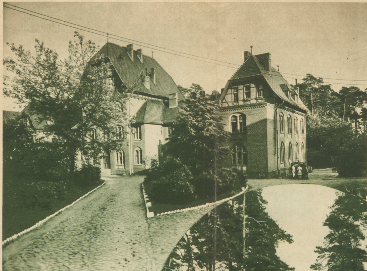
▼ Gmach główny

Jako pomocnicze środki lecznicze stosujemy w ściśle dobranych wypadkach przetwory złota, wlewania wapnia, tuberkuline, krzem i niejedne inne leki, co do których nauka sąd swój wydała. Sanatorium nie może być terenem dla eksperymentów na pacjencie. Obraz gruźlicy płuc pozornie tak jednolity, jest bardzo bogaty w odmiany. Niema dwóch chorych pod względem chorobowym sobie równych. To też na indywidualnem przystosowaniu odpowiedniego sposobu leczenia do każdorazowego obrazu klinicznego polegają sztuka i skuteczność leczenia. Leczenie gruźlicy płuc w okresach rozwoju powinno być tylko sanatoryjne. Pierwsze miejsce zajmuje kuracja klimatyczno-dietetyczna, na drugiem miejscu stawiamy zabiegi operacyjne, które zastosowane fachowo przez lekarza specjalistę, powiększyć mogą ilość wyleczeń o 30 do 40 proc.