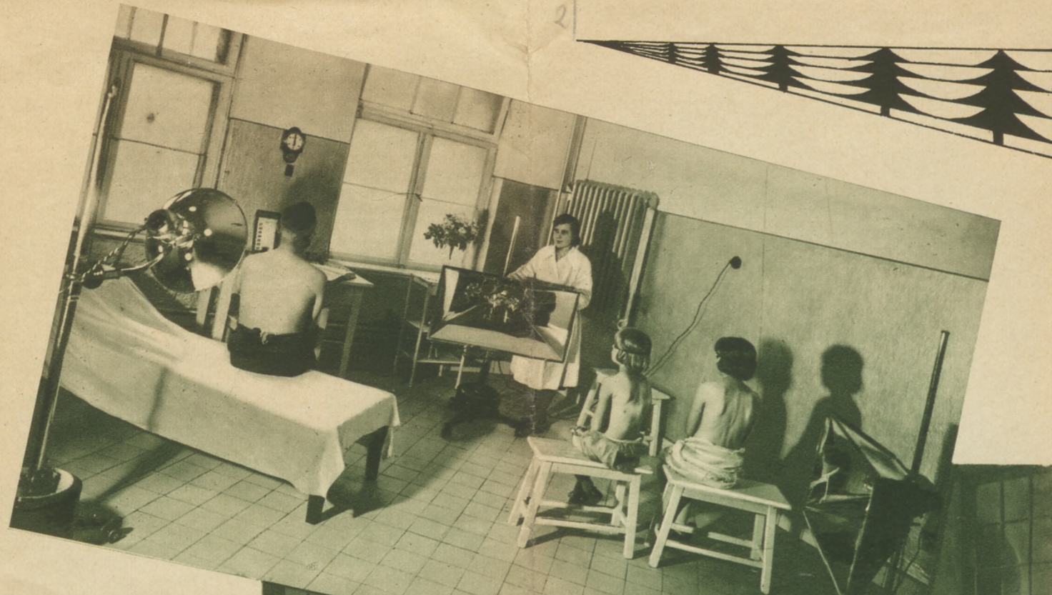
▼ Sala główna

Jacy chorzy powinni przyjeżdżać do Smukaly? Przedewszystkiem ci, u których stwierdzono czynną gruźlicę płuc, chorzy z rozwinętą gruźlicą płuc i skłonni do krwotoków. Dalej chorzy z powikłaniem krztaniowym, którzy w górskim klimacie przebywać nie mogą.