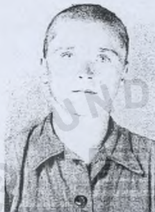
Więżniarka nr 13170, dane personalne i los nie ustalone.

Kobiety - transport z 30 lipca 1942 roku