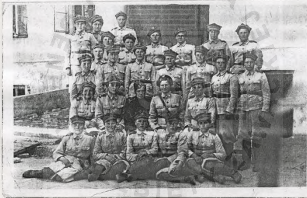
1. WSK - Jesli Osobne