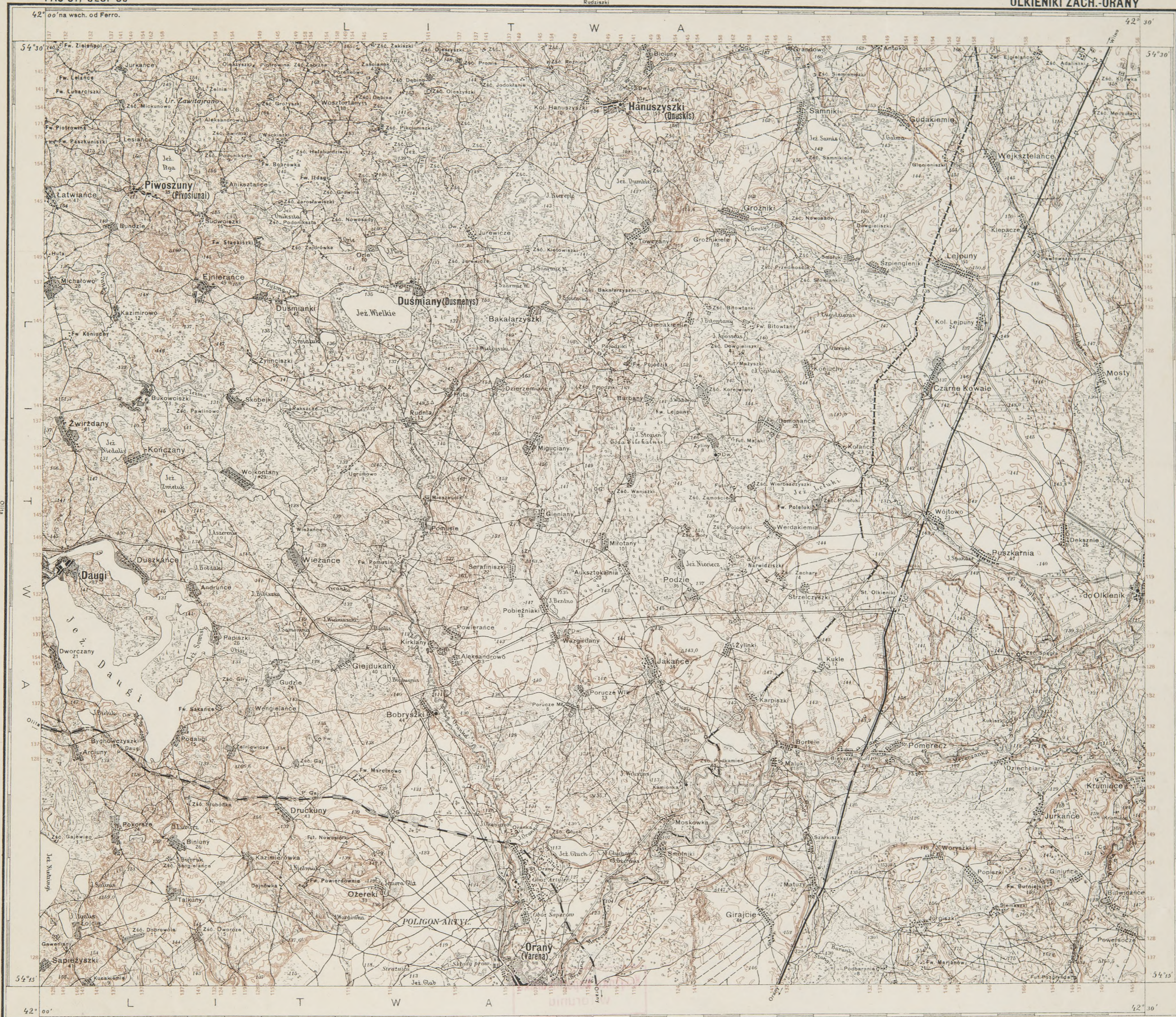
Objaśnienie odczytania warstwic arkusza OLKIENIKI ZACH.-ORANY