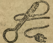
Protos-Grzałka do wody

kompl. z 2 m sznurem przyłącz. EFW zł 74.—