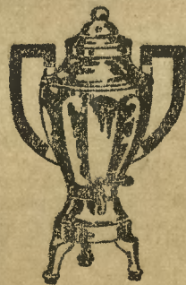
Graetz-Maszynka do kawy

Filja Inowrocław, ul. Dworcowa 20. (24897)