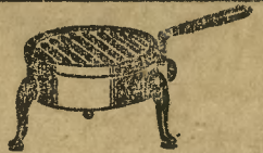
Protos-Płyta do gotowania