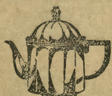
Protos-Maszynka do herbaty

kompl. z sitkiem do wyciągania, przymocowanym w guziezku przy pokrywie EMT 300 zł 55.05