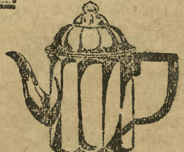
Protos-Maszynka do kawy

kompl. z patentowym przyrządzeniem do filtrowania EMK 300 zł 67.10