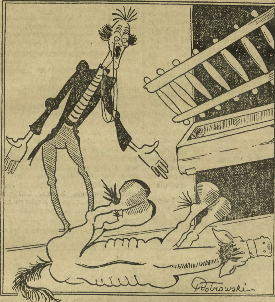
Urządnic (na widok zdechłej kasztanki:) Teraz chyba kolej na mnie!