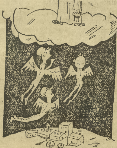
Wielu urzędników zostanie powołanych na wyższe stanowiska...