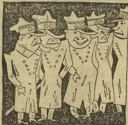
Z chorób ciężkich srożyć się będzie „grypa” pułkowników.