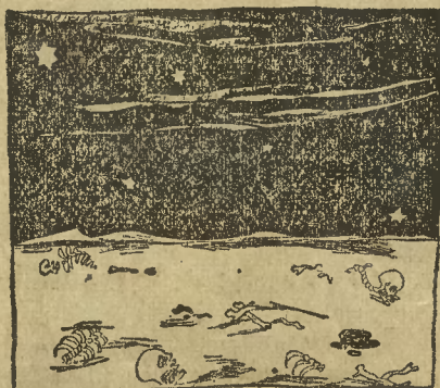
I wogóle są dane po temu, że kryzys minie.