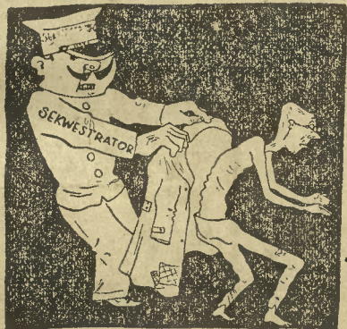
Obywatelom będzie lżej. Przyczynią się do tego komornicy.