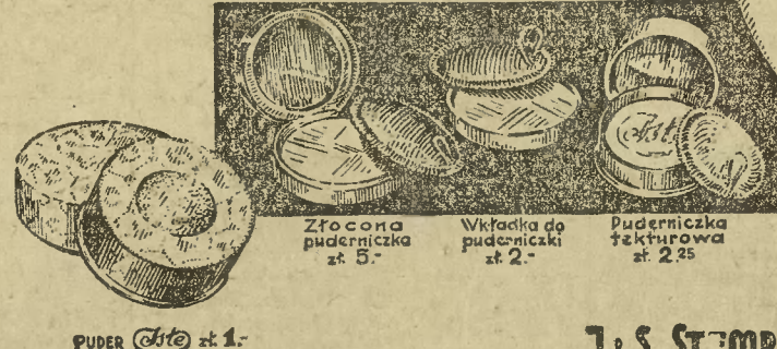
PUDER Este - 1-