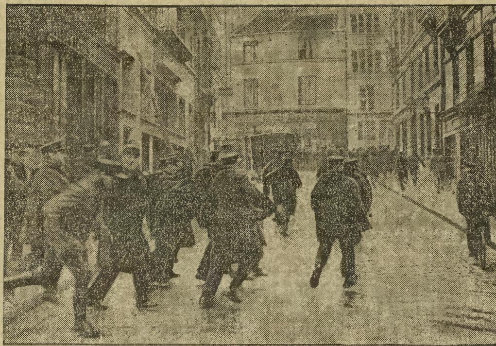
Upadek gabinetu Laval wywołał wśród studentów Paryża wrzenie. Zdaniem ich, nie powinno się to było stać. To też urządzali awantury po ulicach, które policja tłumić musiała. Jedną taką scenę podajemy na rycinie.