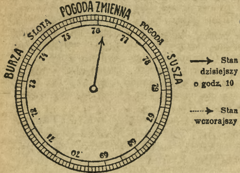
Stan barometru bez zmiany.

Zewsząd donoszą o znacznym wzroście temperatury. W dniu wczorajszym notowano w Bydgoszczy o godz. 2 po południu w słońcu 34 stopni! Wieczorem i nocą przeszły burze, jednak jeszcze jest parno (przy 25 stopniach o godz. 10 przed południem) i skłonność do atmosferycznych wyładowań.