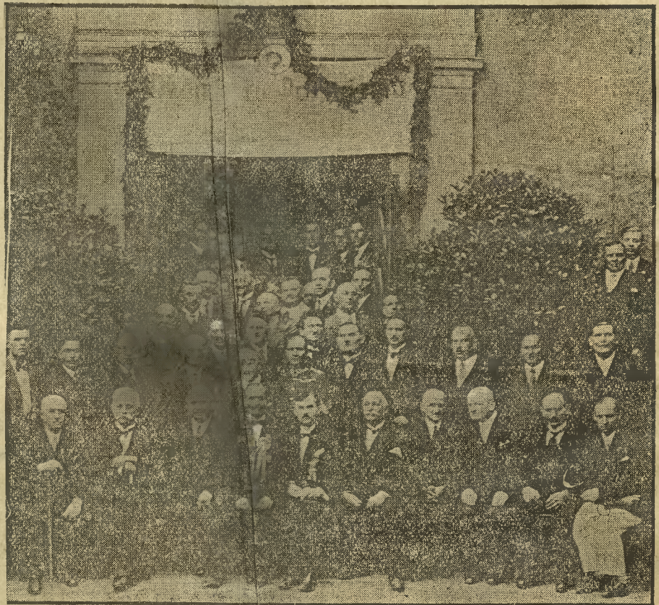
Organizatory i protektorzy wystawy.