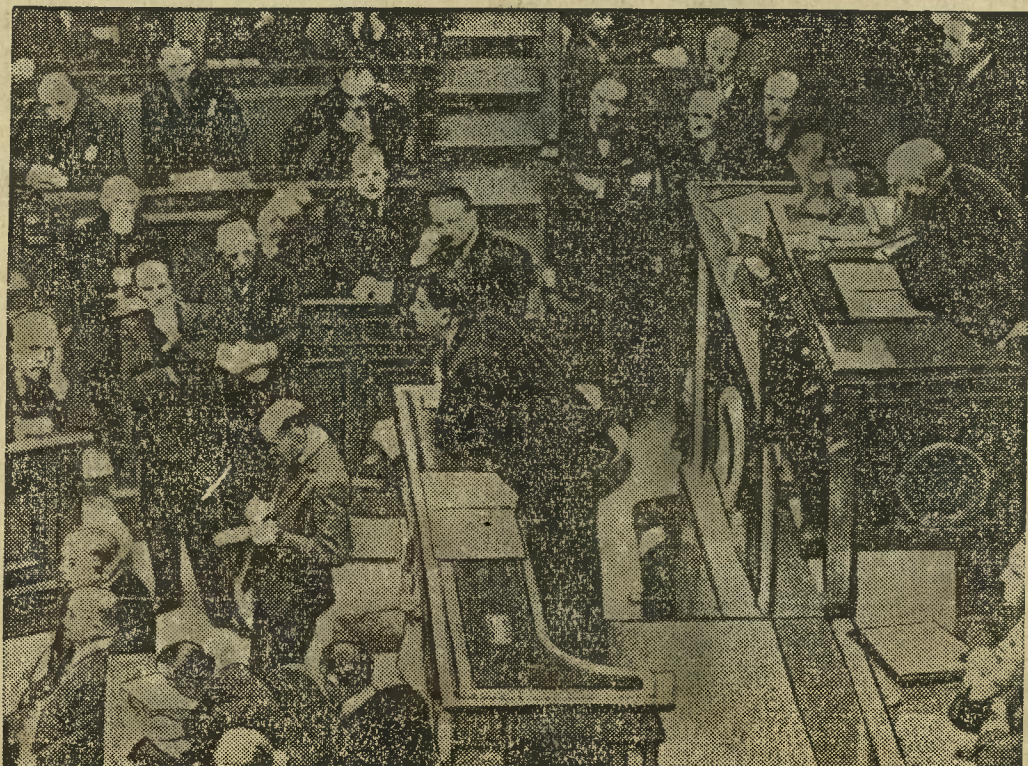
Ostatnia mowa Herriota w parlamencie francuskim.

Herriot upadł, bo chciał zapłacić i ponieważ zgadzał się na Gleichberechtigung. Jeżeli nawet powróci do rządów, co jest uważane za możliwe, należy przypuszczać, że jego metoij już nie wspaniałości, ale rzucania się na szyję wrogom, będą musiały zostać... zlagodzone. (ro)