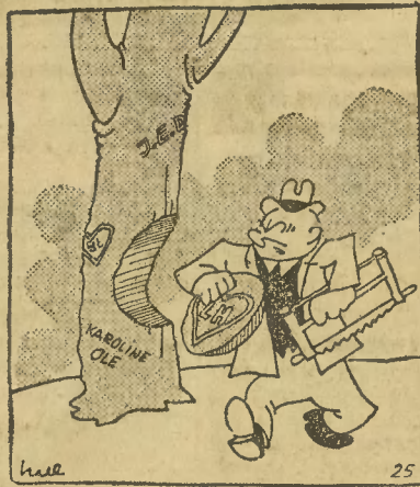
Po zerwanych zaręczynach.