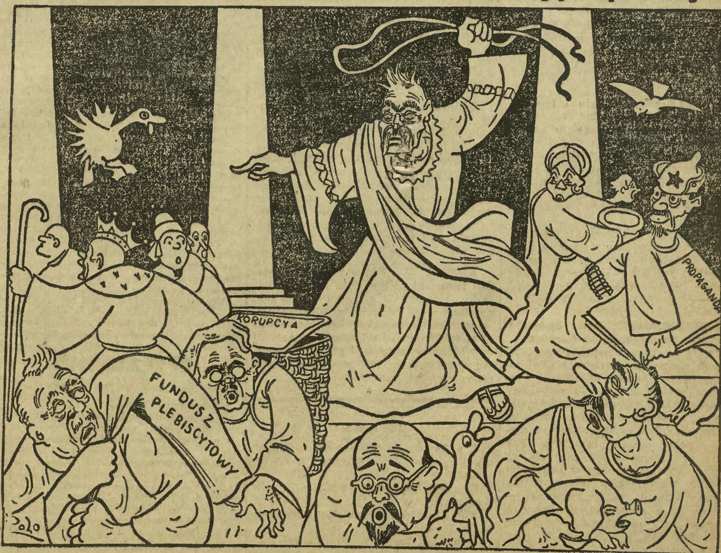
czyli noworoczny program pana marszałka Piłsudskiego.