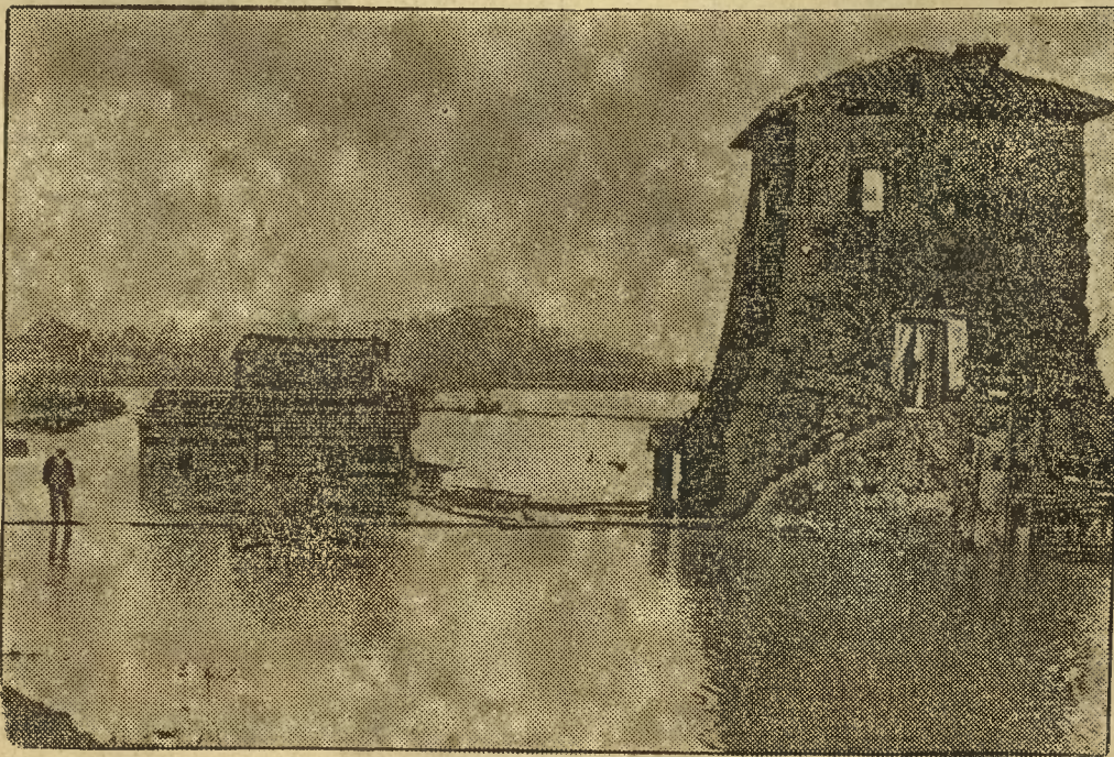
Ogromne szkody wyrządziła powódź w środkowych Włoszech. Rzeki, które wystąpiły z brzegów koło Rzymu, w Umbrii, w Abruzzach, zalały pola uprawne i zamieszkałe miejscowości. Na zdjęciu pola pod wodą koło Rzymu.