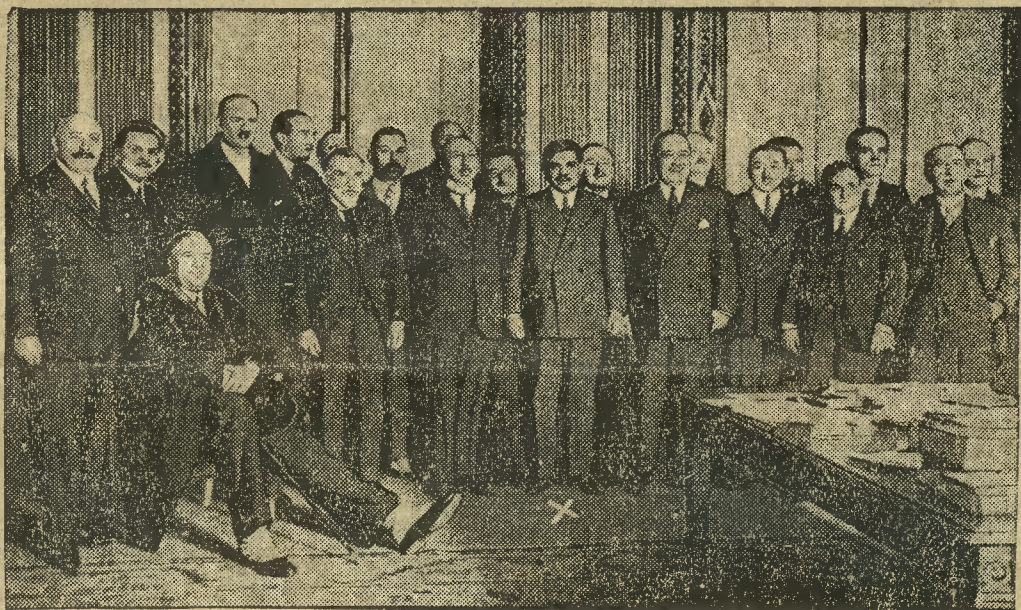
W środku (+) prezydent ministrów Laval. Obok niego po prawej stronie minister rolnictwa Tardieu, po lewej Pietri (finanse), obok Dusmenil (lotnictwo). Na fotelu siedzi minister spraw wojskowych Maginot.