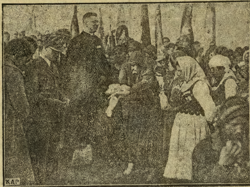
Delegacja z całej Polski składająca grudki ziemi na syjącym się tuż nad granicą kopca Wyzwolenia dla upamiętnienia 250-letniej rocznicy odsieczy wiedeńskiej — na zdjęciu dziewczęta ze Lwowa składają ziemię z Oleska (miejsce urodzenia Jana III).