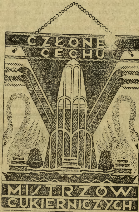
OTO GODŁO PRAWDZIWEJ CUKIERNI

W kołach fachowych wiadomość o tym egzaminie przyjęto z podziwem i zadowoleniem.