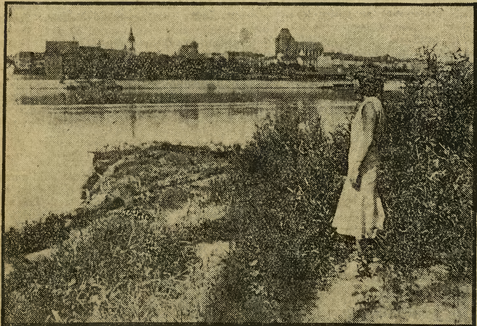
(y). Nad zielonemi falami majestatycznie płynącej Wisły wznoszą się czerwone wieże i mury 700-letniego miasta-jubilata. Brzegi rzeki pokryte są przeważnie wikliną i stanowią miłe miejsce odpoczynkowe dla Torunian.