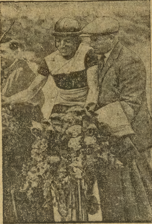
LACQUEHAY (FRANCJA) zdołwał mistrzostwo kolarskie świata dla zawodowców.

w VI-kl. Szkole Przygotowawczej T. N. S. W. przy ulicy Paderewskiego 2, telefon 20-41.