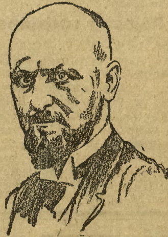
Prof. Zankoff, b. premier i przywódca nacjonalistycznej opozycji cudem wyszedł cało z zamachu bombowego. Pewien komunistą rzucił dwa granaty ręczne. 2 osoby towarzyszące b. premierowi zostały ciężko ranne.