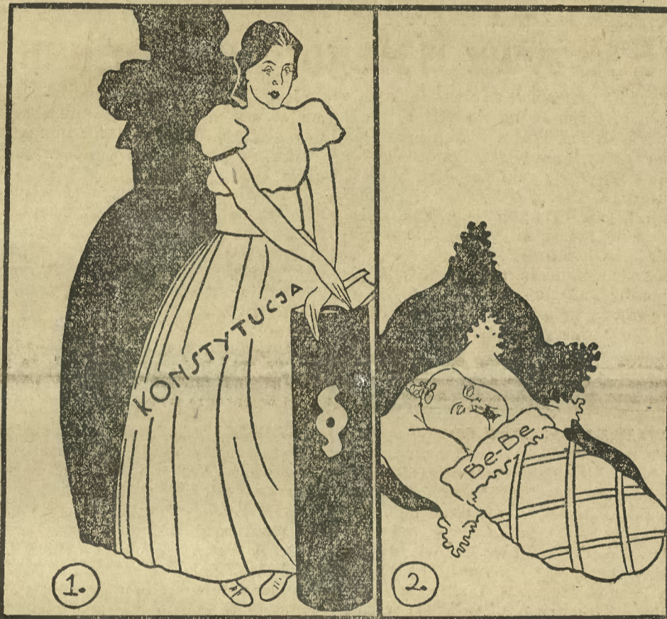
Z tego wniosku prosty, że można ją zmienić na drobne.