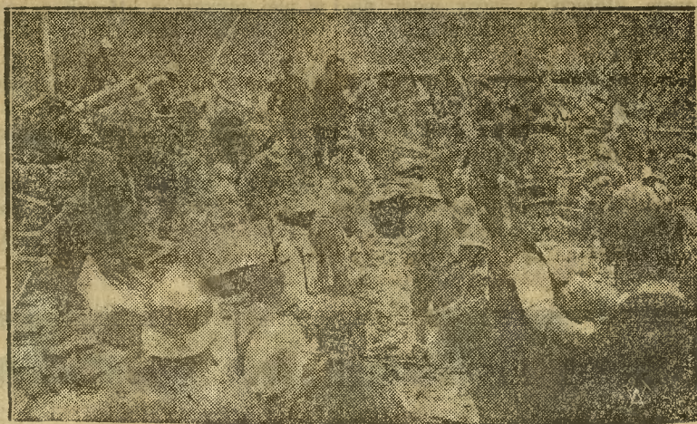
Jak to już donosiliśmy na przedmieściu Paryża Billencourt wybuchł wielki kocioł w fabryce samochodów Renaulta. Eksplozja była tak silna że dach kotłowni wyleciał w powietrze. Odłamki żelaza i cegiel posypały się na sąsiednie pawilony fabryczne. Pod naporem rumowisk dach jednego z pawilonów załamał się, grzebiąc pod gruzami robotników. Na ilustracji widzimy akcję ratowniczą, przy wydobywaniu zaspanych robotników.