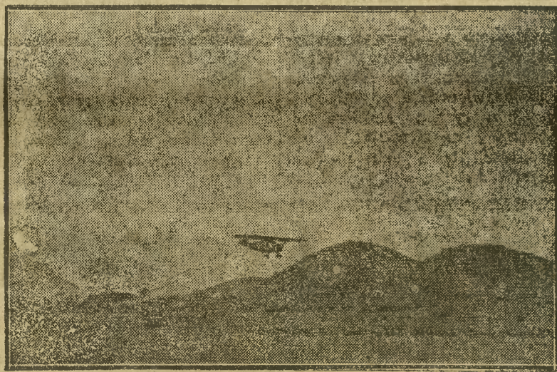
Na zdjęciu naszym widzimy samolot kapitana Skarżyńskiego R. W. D. 5 lądujący na lotnisku w Rio de Janeiro w dniu 11. V. 1933

Porto Allegre 10. 6. (PAT) Znamienny lotnik polski Skarżyński wylądował pomyślnie w Porto Allegre.