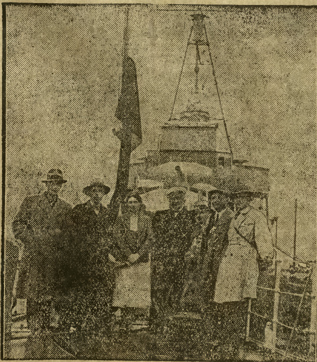
Dnia 3 bm. wypuszczono pierwszy pociąg bezpośredni Warszawa—Hel, nazwany „Strzałą Bałtycką“. Na inauguracyjny przejazd Ministerstwo Komunikacji zaprosiło licznych przedstawicieli prasy. — Na zdjęciu rzędem wstępu przedstawiciele prasy po przybyciu do Gdyni, na pokładzie kontrtorpedowca „Wicher“