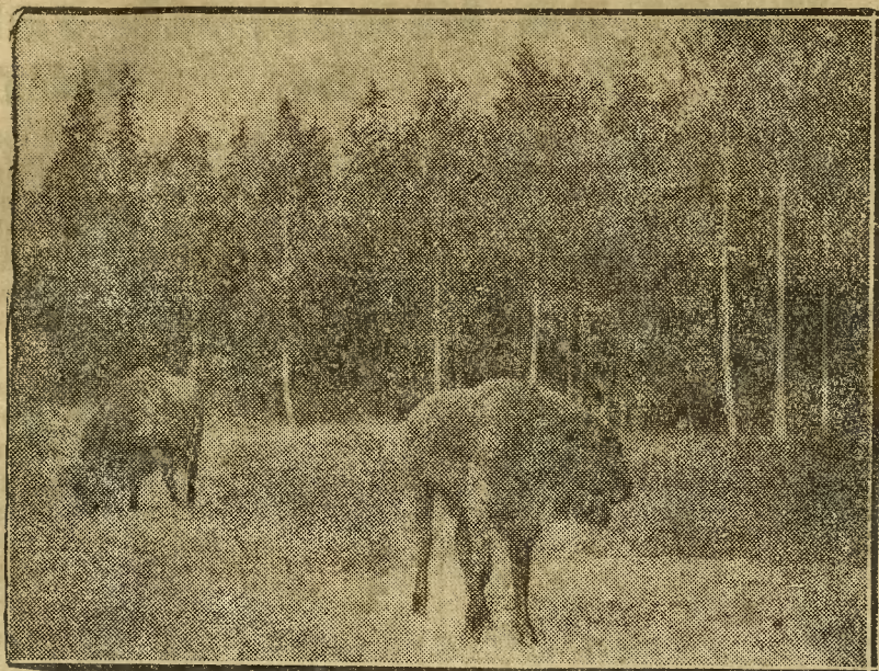
Do najrzadszych zwierząt nie tylko w Europie, ale i na całym świecie należą dziś żubry, z których na wolności żyje tylko kilkanaście sztuk w Puszczy Białowieskiej, a kilkanaście innych rozsianskich jest po zwierzęcych europejskich. Na zdjęciu naszym widzimy parę żubrów w Puszczy Białowieskiej, pasących się na polanie