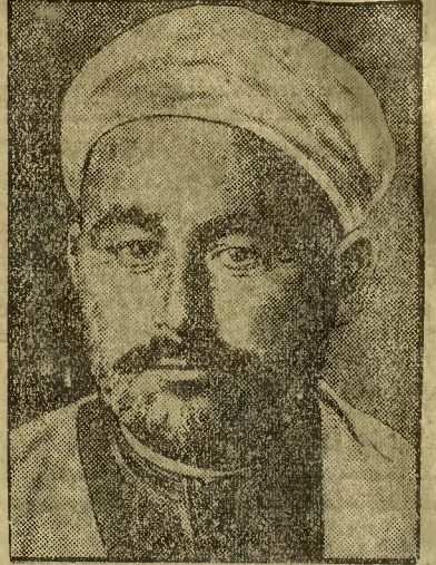
zesłany na wyspę Reunion prosi Francję o zwolnienie na powrót do Ojczyzny.