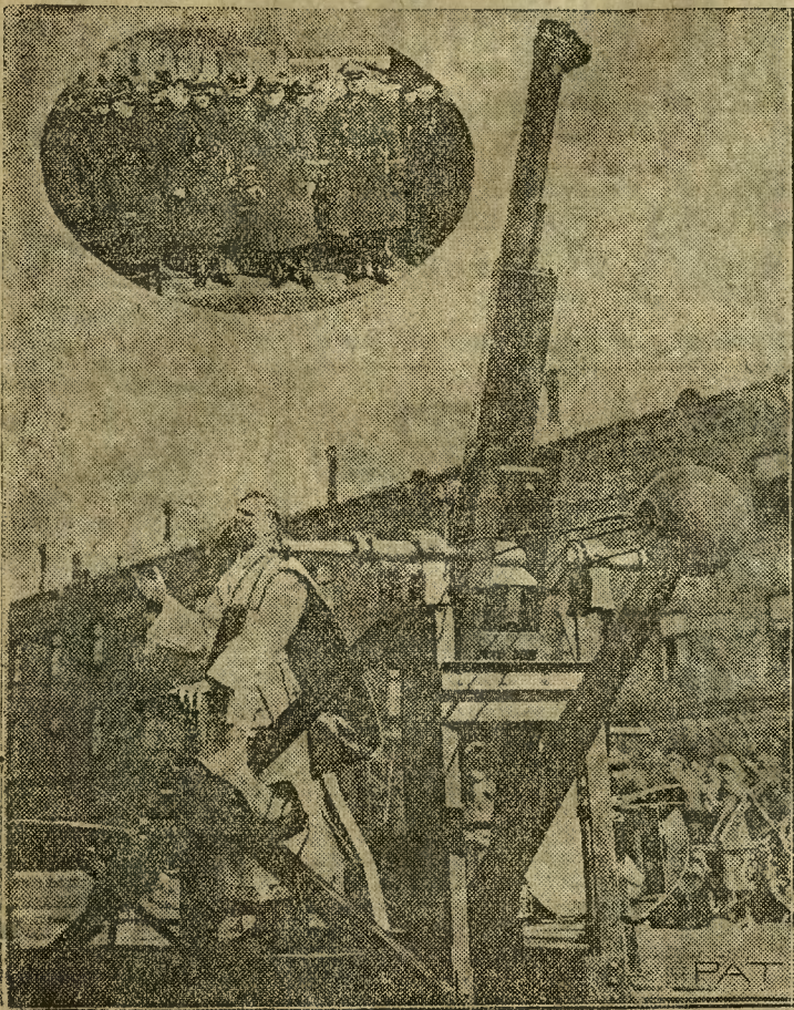
ŚWIĘTO I. PUŁKU ARTYLERII PRZECIW LOTNICZEJ.