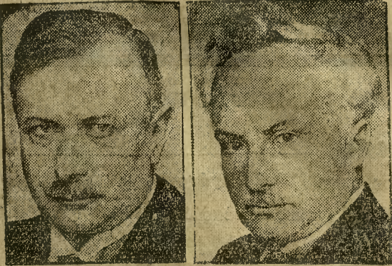
Ministrowie spr. wewn. Rzeszy i Prus.

Sytuacja wewnętrzno-polityczna w Niemczech przybiera w ostatnim czasie tak groźne rozmiary, — iż wobec coraz liczniejszych z dnia na dzień wykroczeń i krwawych bojek partyjno-politycznych okazało się konieczne zwołanie wielkiej narady politycznej ministrów spraw wewnętrznych Niemiec, w której wzięli udział minister Rzeszy dr. Wirth i m.in. pruski Sewering oraz ministrowie saksoński, bawarski, wirtemberski i badeński. Na naradzie rozważano sprawę obostrzenia zarządzeń przeciw nadużyciu broni w celach politycznych.