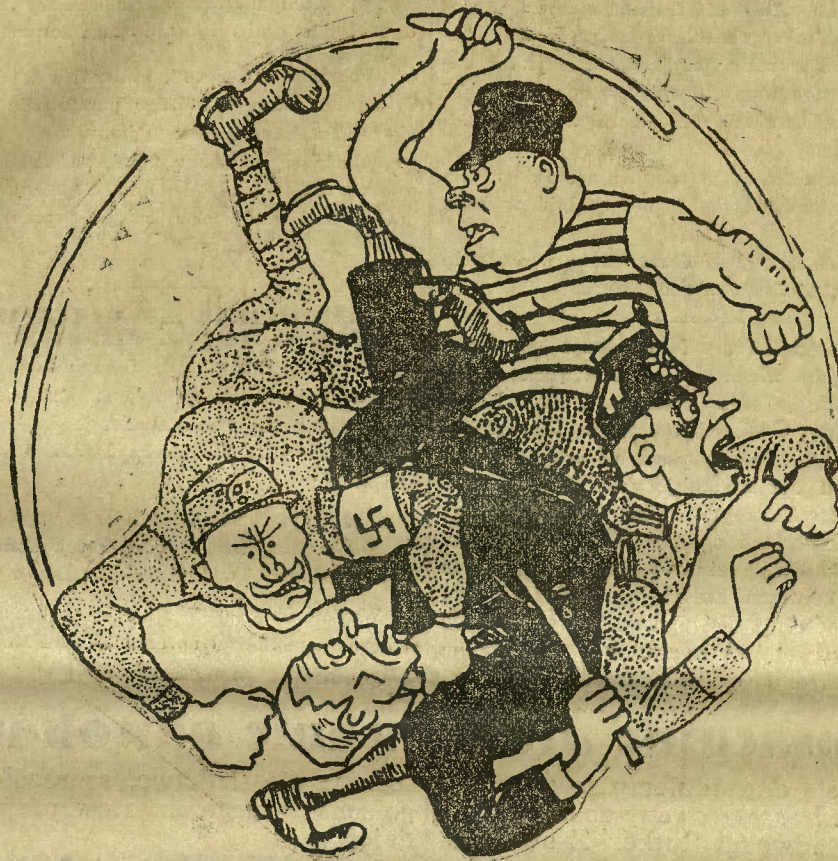
Sytuacja wewnętrzna Niemiec czyli „Deutsche Wirtschaft”.