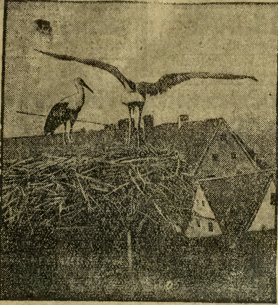
BOCKI JUZ PRZYLECIAŁY...