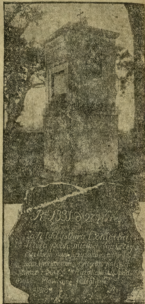
W 600 rocznicę pogromu krzyżackiego pod Płowcami wybudowano na polu bitwy kapliczkę, na której wmurowano kamień z pamięcią kowym napisem.