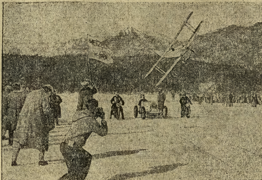
W Szwajcarii odbył się onegdaj tradycyjny wyścig między samochodem, motocyklem i samolotem. przyczem awionetka biorąca udział w wyścigu, leciała zatrważająco nisko nad jeziorem alpejskim.