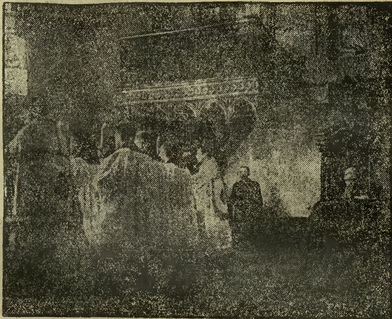
Na zdjęciu drugiem podajemy fragment z uroczystego nabożeństwa w katedrze św. Jana w Warszawie. Na zdjęciu tem na prawo obok grona kapłanów widzimy p. Prezydenta R. P. (X), dalej na prawo nuncjusza Apostolskiego w Warszawie (XX).