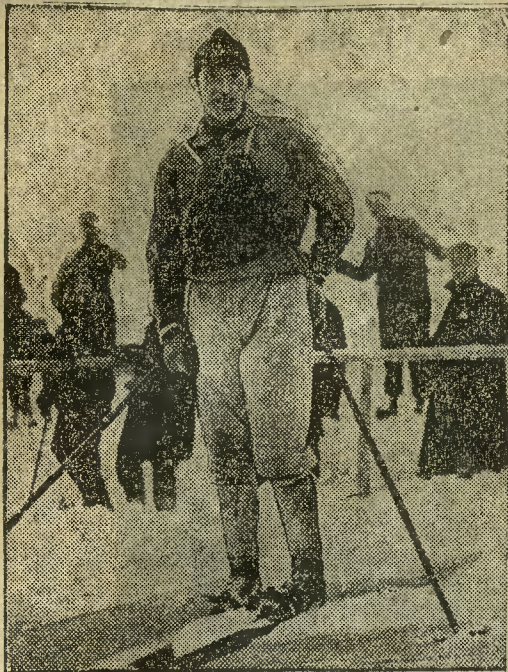
Groettumbrassen (Norwegia) mimo swych 34 lat odniósł ponownie zwycięstwo w kombinowanym biegu narciarskim.