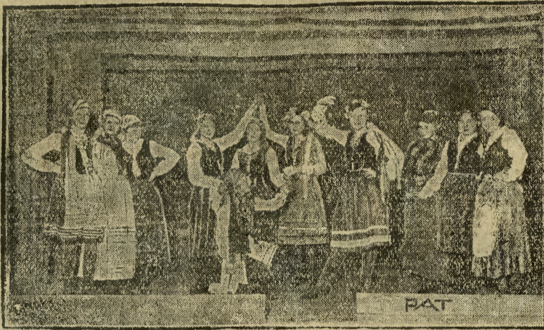
Dnia 11 kwietnia r.b. odbył się w Dynaburgu w tygodniu propagandy oświaty ludowej dzień propagandy harcerstwa. Po odczytach odbyło się przedstawienie polegające na inscenizacji piosenek ludowych. Zdjęcie przedstawia fragment piosenki „Pokłoń się Hanuś” w wykonaniu harcerek dynaburskich polskich drużyn żeńskich.