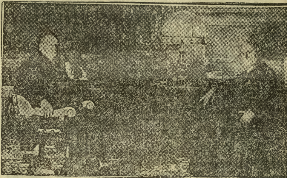
W pałacu weneckim w Rzymie Litwinow na Konferencji z Mussolinim.