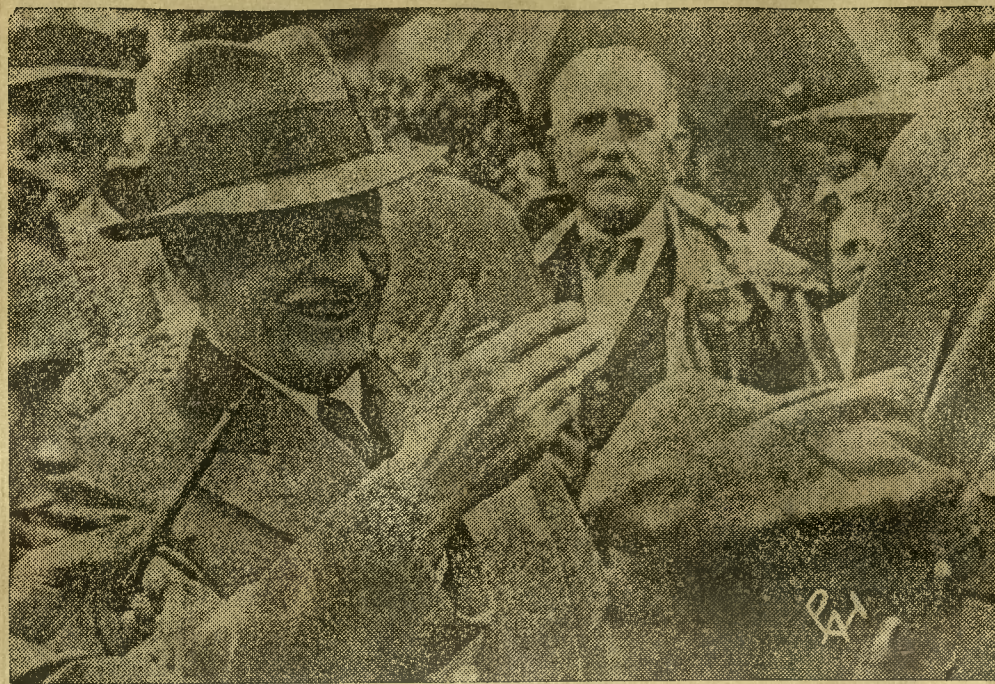
Po wielkiej defiladzie harcerskiej w Spale Pan Prezydent Rzplitej złożył swój podpis w księdze harcerskiej. Na zdjęciu — Pan Prezydent Rzplitej otrzymuje pióro do podpisu.