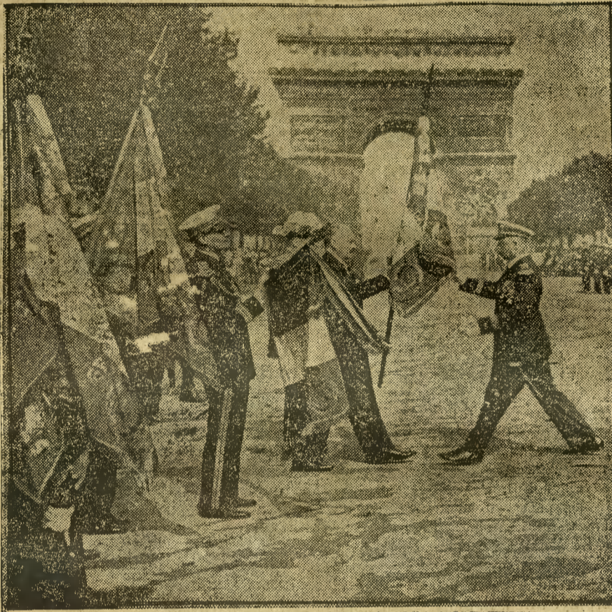
W niedzielę 14 bm. w czasie wielkiej rewii na Polach Elizejskich prezydent Lebrun wręczył oddziałom lotniczym nowe sztandary.