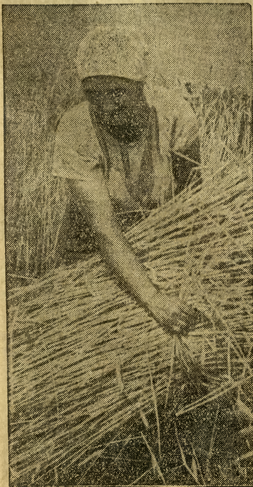
Zniwa się zaczęły.