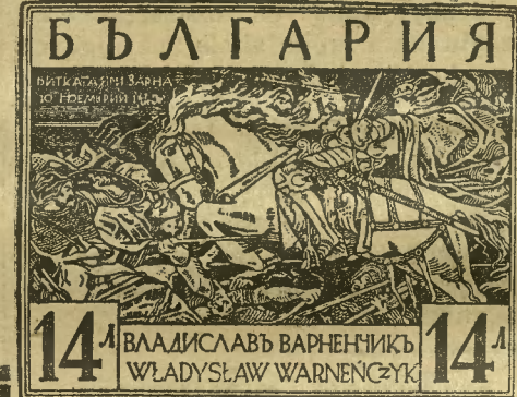
Nowe znaczki pocztowe, wydane przez pocztę bułgarską z okazji uroczystości warneńskich przedstawiające króla Władysława Warneńczyka i jego Mauzoleum w Warnie.

młodzieży, organizacji sportowych, społecznych i in. Oficjalny udział również w uroczystościach wezmą państwa: Polska, Węgry, Włochy, Czechosłowacja i prawdopodobnie Jugostawja.