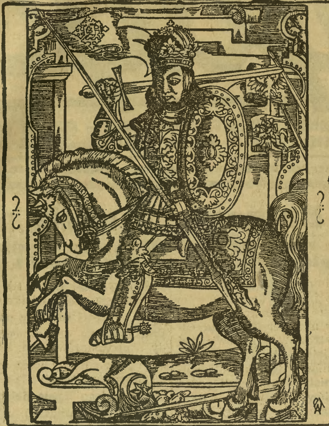
Król Władysław III Warneńczyk — drzeworyt z kroniki A. Gwagnina.

W uroczystościach warneńskich weźmie udział cały garnizon warneński, wszyscy ministrowie bułgarscy, dowódcy wszystkich garnizonów bułgarskich, przedstawiciele władz administracyjnych, samorządowych.