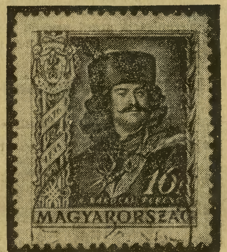
Poczta węgierska wydała serję znaczków pocztowych z racji 200 rocznicy śmierci Franciszka Rakocznego.