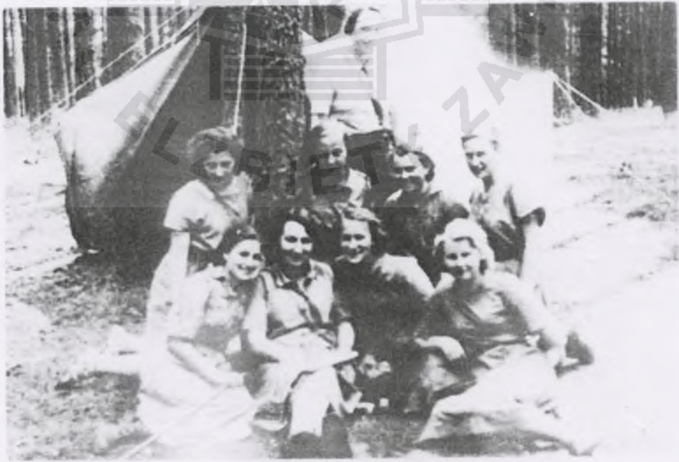
-- przed 1939 -- na obozie harcerskim