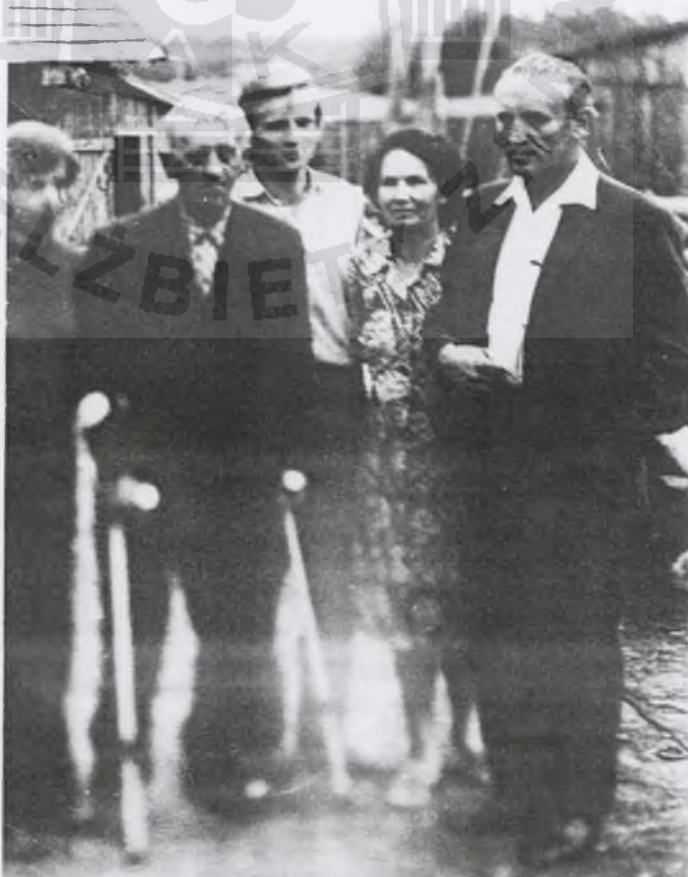
Rodzina Jastaków - mąż, żona, córka, syn i „Dob-jas” - odwiedziły 197... rok 9