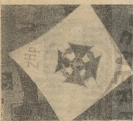
standard bruckiej drużyny

„Różniczkę Trybunał Ludowy rozpatrywał sprawę zbrodnię byłych obywateli polskich, po większej części byłych polskich gimnazjalistów oskarżonych o słuchanie wrogich audycji radiowych i o rozpowszechnianie wrogich wiadomości w postaci ulotek. Zostali skazani za przygotowanie zdrady stanu — oskarżony CZECHOLINSKI na 15 lat ciężkiego więzienia i na 10 lat utraty praw honorowych, TADEUSZ BUKOWSKI na 3 lata ciężkiego więzienia i 3 lata utraty praw honorowych, WITOLD KAZMIERSKI na rok i 6 miesięcy ciężkiego więzienia, ROMUALD HOPPE na 10 lat ciężkiego więzienia i 10 lat utraty praw honorowych.”