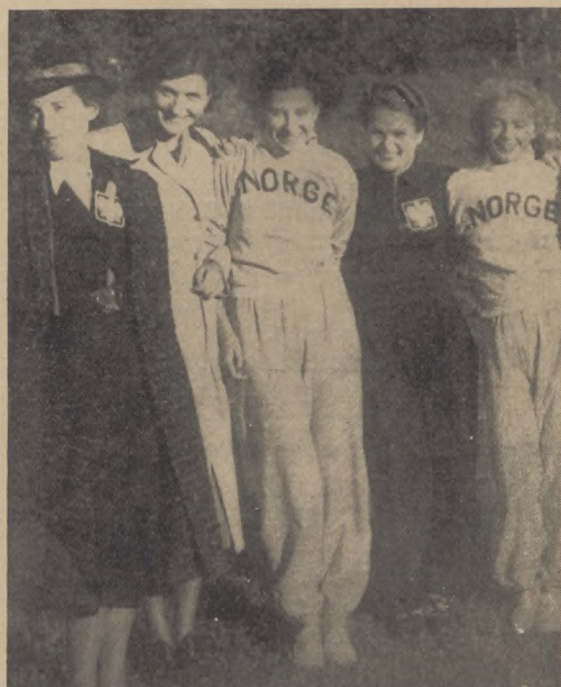
Pomorzanki na pierwszych lekkoatletycznych Mistrzostwach Europy pań.

Ogółem statystycznie ujętych sędziowań 1875 .