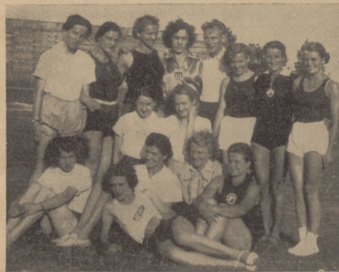
Grupa uczestniczek obozu treningowego przed spotkaniem Polska-Niemcy pań w Bydgoszczy.

Przeprowadzenie zaś mistrzostw Polski pań przez miasto Grudziądz było ukoronowaniem dotychczasowej pracy tego Ośrodka nad rozwojem lekkiej atletyki zwłaszcza pań.