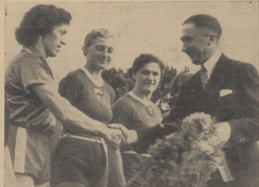
XVII. Główna Lekkoatletyczne Mistrzostwa Polski Pań w Grudziądzu.