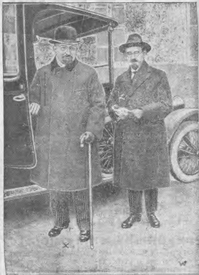
Rycina nasza przedstawia sowieckiego komisarza dla spraw zagr. Cziczerina w towarzystwie ambasadora sowieckiego Krestinskiego w Berlinie, krótko przed odjazdem z dworca do ambasady sowieckiej.