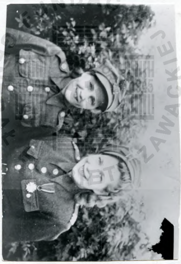
Matka i sestra u 1944u Bat. Samit.