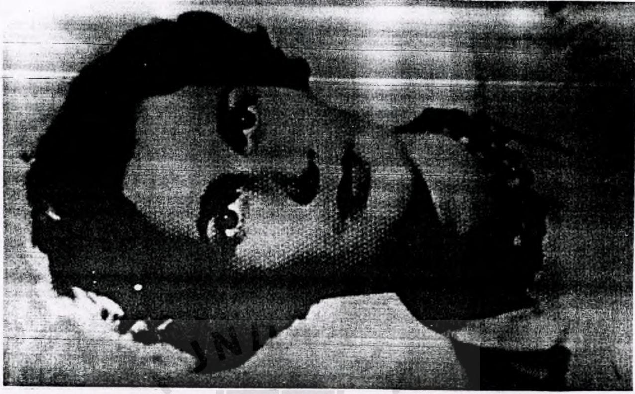
Comendant Partyzancki w lesie majdankim