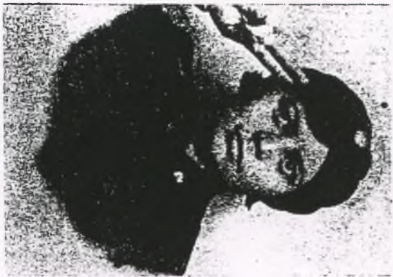
Zofia Wątył 2-ty Komendantka Hulca Żeńska- go ZHP, rozstrzelana z całą rodziną w Skarżysku -Bór 12.02.40